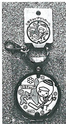
写真5 レザーキーホルダー

さらに、今後の展開として、マンホール蓋デザインのアイスホッケーパックなど、各種グッズの展開を行う予定です。