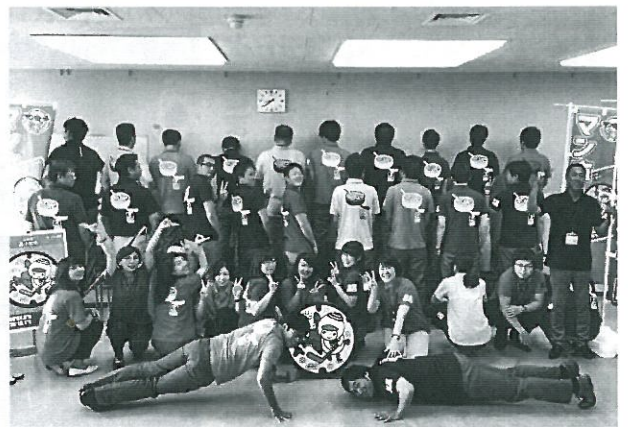
写真4 マンホールポロシャツ

また、とまちヨップマンホール蓋のオリジナルグッズとして、レーザーキーホルダーを一般社団法人苦小牧観光協会が発売しています(写真5)。