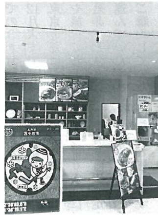
写真3 「観光スポット」とカード

また、カードを配布している街の観光スポットへ行き、その土地の文化や名産品に触れることも楽しみ方の一つです(写真3)。