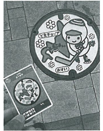
写真2 「マンホール蓋」とカード

マンホールカードは、コレクションの他にもさまざまな楽しみ方があります。カードには位置座標が記載され、実際にカードとなったマンホール蓋が設置してある場所を示します。カードをゲットしたら、現地を訪れて実物のマンホール蓋と一緒に写真を撮るのがオススメです(写真2)。